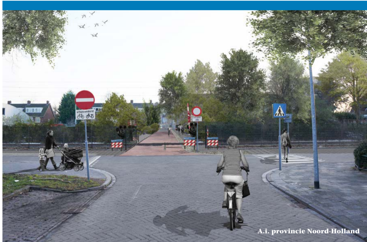
A.i. provincie Noord-Holland

HOV in 't Gooi zorgt voor een frequente, comfortabele en betrouwbare busverbinding voor reizigers tussen Huizen en Hilversum. De voorziening vormt een duidelijk alternatief voor fiets, auto of de reguliere regionale buslijnen. De komende jaren wordt de busverbinding aangelegd. Dat gaat u merken: in eerste instantie ervaart u hinder, op de lange termijn heeft u profijt.